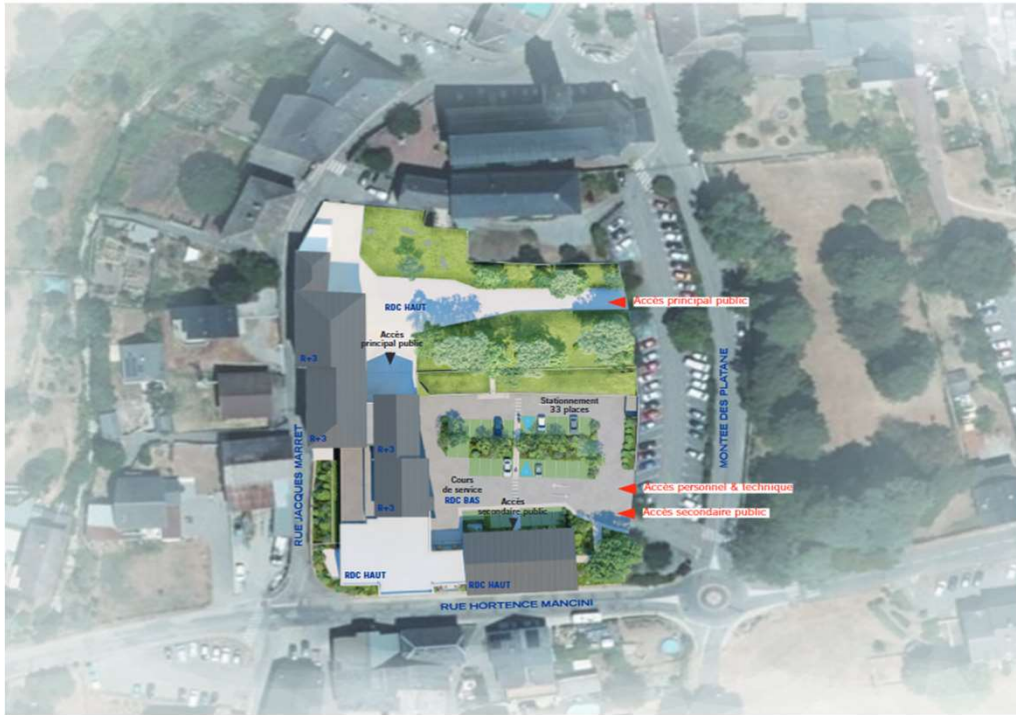
Le plan de masse présentant le futur projet immobilier

Jeudi 31 juillet 2025, le projet immobilier du centre hospitalier de Saint-Pierre-D'Albigny se dévoile à la presse devant les élus et l'agence régionale de santé (ARS), en présence de l'agence d'architecture ayant remporté l'appel d'offres.