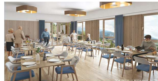
Vue depuis le restaurant du SMR